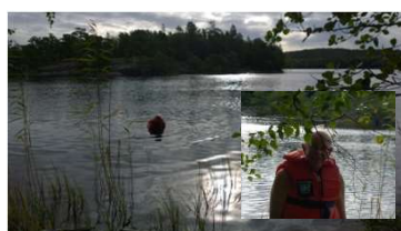
Här har jag just loggat en av de mest utmanande cacharna; Holmen i Gröndals träsket i Geta efter simtur på ca 50 meter 19.9.2015.

Också denna sommar arbetade jag som volontär i S:t Mikaelsskyrkan i Tallinn och i estlandssvenskarnas museum, Aibolands Museum i Hapsal. Och så har jag besökt mina favoritöar i Estland: Ormsö 5 gånger, Kihnu 2 gånger, Prangli 2 gånger, Manija 2 gånger, Aegna 1 gång, Nargö 1 gång och Runö 1 gång.