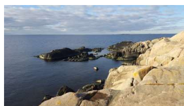
I det vackra höstvädret gjorde jag flera vandringar på Kökar, Sottunga och Brändö/Jurmo för att logga cachar. Bilden är från Kökar.

Under året har jag fått uppleva natur och kultur genom geocaching samt besökt platser som jag knappast annars hade besökt. I en smarttelefon eller GPS navigator ställer man in koordinater och beger sig ut i skog och mark och letar efter cachan. Under året har jag loggat över 500 cachar och gömt cachar i Vårdö, Kumlinge och Iniö. www.geocaching.com 😊