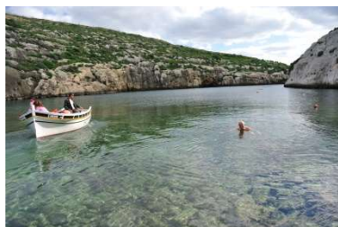
Julen 2014 firade jag åter på Gozo på Malta och badade på julaftonen i Medelhavet.