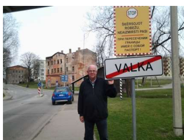
Gränsen mellan Valka i Lettland och Valga i Estland.

Ett gammalt år som har innehållit många fina upplevelser börjar gå till ända. Under året har jag gjort många resor till närområdena; Sverige, Norge, Estland, Lettland, Litauen och Ryssland. Det var trevligt att få guida två grupper till Iniö där jag bodde 1977-1990 samt vara reseledare för en bussgrupp från Åland till Stormskärs Maja som visades på Åbo svenska teater.