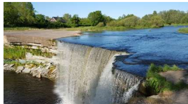
Jägala juga vattenfallet i Estland.