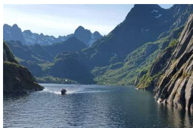
I augusti åkte jag på en båtkryssning längs Hurtigruten från Kirkenes till Bergen.

Ett gammalt år som har innehållit många fina upplevelser börjar gå till ända. Under året har jag gjort många resor till närområdena; Sverige, Norge, Estland, Lettland, Litauen och Ryssland. Det var trevligt att få guida två grupper till Iniö där jag bodde 1977-1990 samt vara reseledare för en bussgrupp från Åland till Stormskärs Maja som visades på Åbo svenska teater.