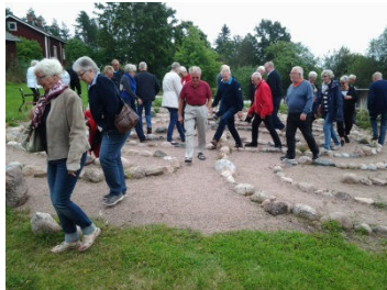
Här får vi litet motion i en jungfrudans efter vårt besök i Verla kartongfabrik.