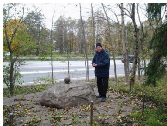
Här är jag nära geocachen vid den okända soldatens grav på Drumsö