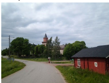
Jag bodde i Iniö 1977-1990