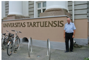
Gustav II Adolf grundade universitet i Dorpat år 1632