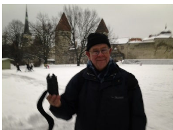
Jag hittade också en geocache, som liknade en katt i ett snöigt Tallinn.