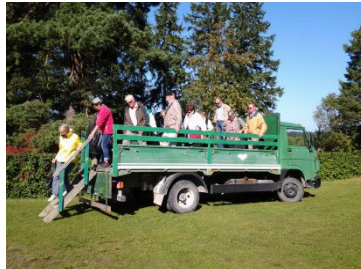
Vi stiger av "lastbilsbussen" på Kihnu.