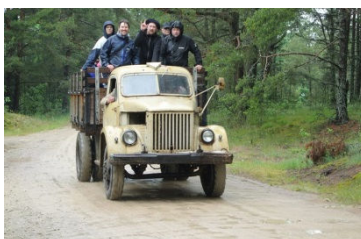
Kollektivtrafiken på ön Prangli i Estland sker med en gammal Gaz.