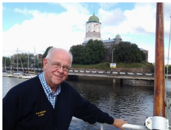
Vi åkte längs Saima kanal från Villmanstrand till Viborg.