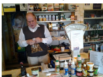
Min favoritbutik i Finland, Ritvalan kyläkauppa i Sääksmäki.