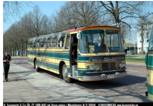
ÅL 77 - Mariehamn