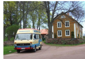
ÅLC 660 - Vargata, Vårdö