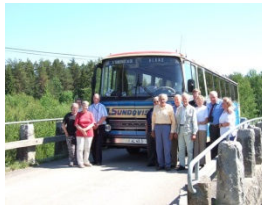
ÅL 45 - Kodjala, Laitila