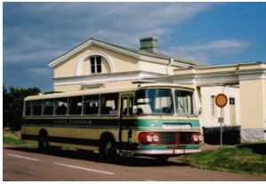
ÅL 126 - Eckerö posthus