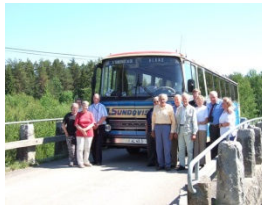
ÅL 45 - Kodjala, Laitila