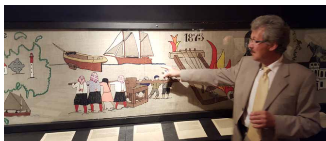
Aibolands museum i Haapsalu.