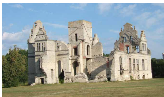
Ungru slott, numera i ruiner, är ett av de mest intrycksfulla byggnaderna i neobarockstil i Estland.