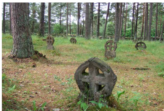
På gravgården i Ormsö finns världens största samling av solkors. Det äldsta med ännu läsbar text är från 1770-talet.