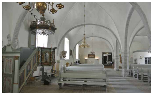
St:t Mikaelsskyrkan i Tallinn byggdes i början på 1500-talet som ett fattigsjukhus.