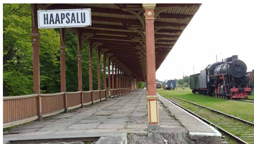
Hapsal järnvägsstation anlades 1903-1905. Den 216 meter långa täckta perrongen var på den tiden Nordeuropas längsta.