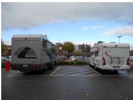
Gävle husbilsparkering. Platsen utmärkt med P-skylt och tilläggs skylt 48 tim.

Vissa kommuner hanterar en husbilsplats/ställplats som en parkeringsplats för husbilar, medan andra kommuner anser att det är en campingplats. Vissa företagare stoppades p.g.a. att kommuner klassar husbilsplatsen/ställplatsen som campingplats eftersom man förväntas övernatta i fordonet. Byggnation av campingplats kräver oftast ändring i detaljplaner, och krånglar till det hela i onödan.