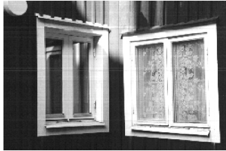
Projektering av byggnadsverk Institutionen för Samhällsteknik

10 § Ändringar av en byggnad skall utföras varsamt så att byggnadens karaktärsdrag beaktas och dess byggnadstekniska, historiska, kulturhistoriska, miljömässiga och konstnärliga värden tas till vara.